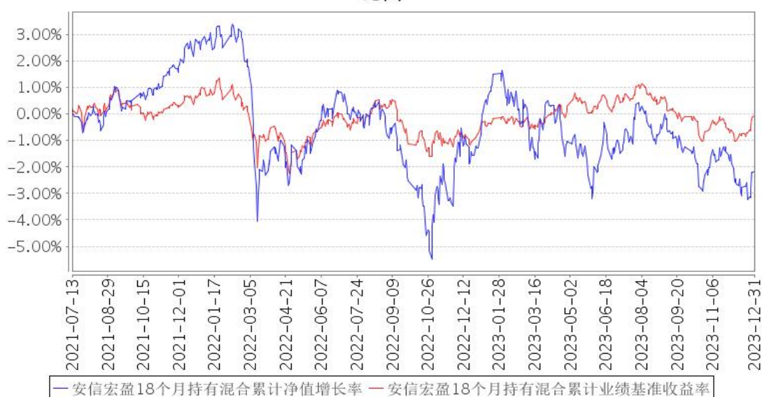
安信宏盈18个月持有混合累计净值增长率与同期业绩比较基准收益率的历史走势对比图