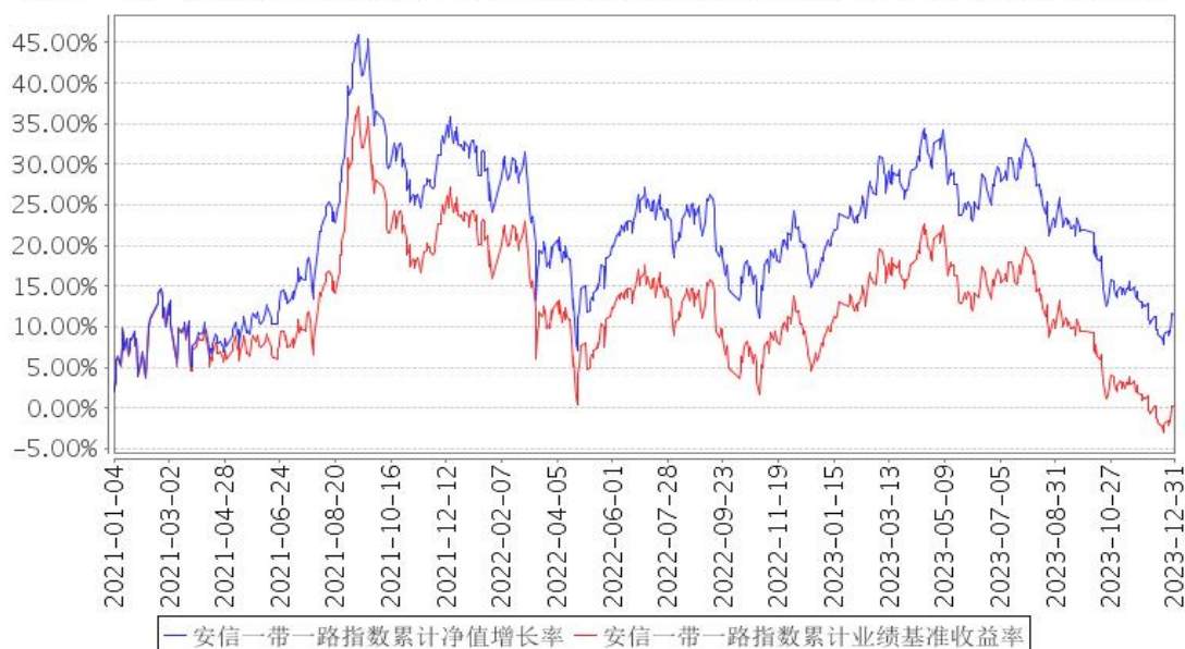
安信一带一路指数累计净值增长率与同期业绩比较基准收益率的历史走势对比图

注：1、本基金 2021 年 1 月 1 日由安信一带一路指数分级证券投资基金转型而成，本基金基金合同生效日为 2021 年 1 月 1 日。