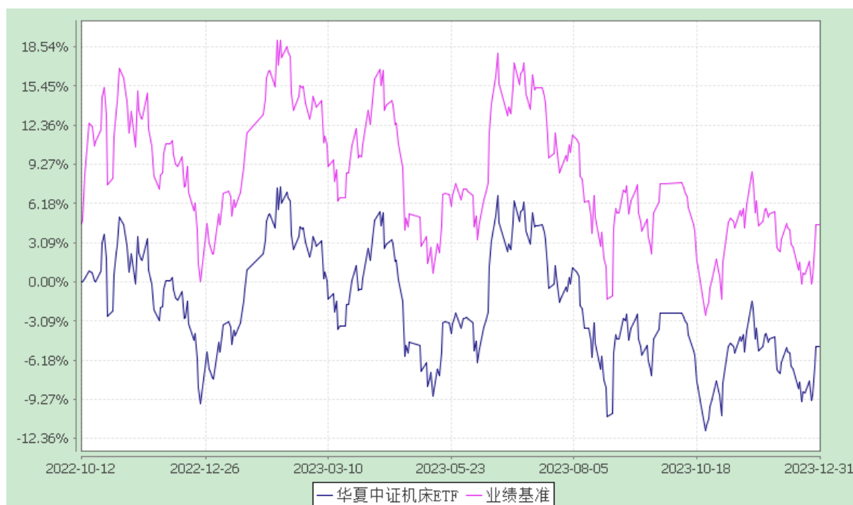
华夏中证机床交易型开放式指数证券投资基金 份额累计净值增长率与业绩比较基准收益率历史走势对比图 (2022 年 10 月 12 日至 2023 年 12 月 31 日)

注：根据本基金的基金合同规定，本基金自基金合同生效之日起 6 个月内使基金的投资组合比例符合本基金合同中投资范围、投资限制的有关约定。