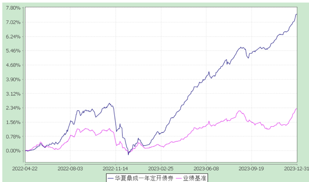
华夏鼎成一年定期开放债券型发起式证券投资基金 份额累计净值增长率与业绩比较基准收益率历史走势对比图 (2022 年 4 月 22 日至 2023 年 12 月 31 日)