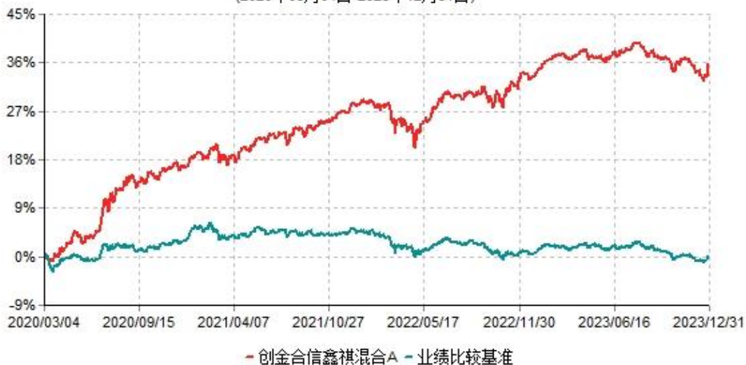
创金合信鑫祺混合A累计净值增长率与业绩比较基准收益率历史走势对比图 (2020年03月04日-2023年12月31日)