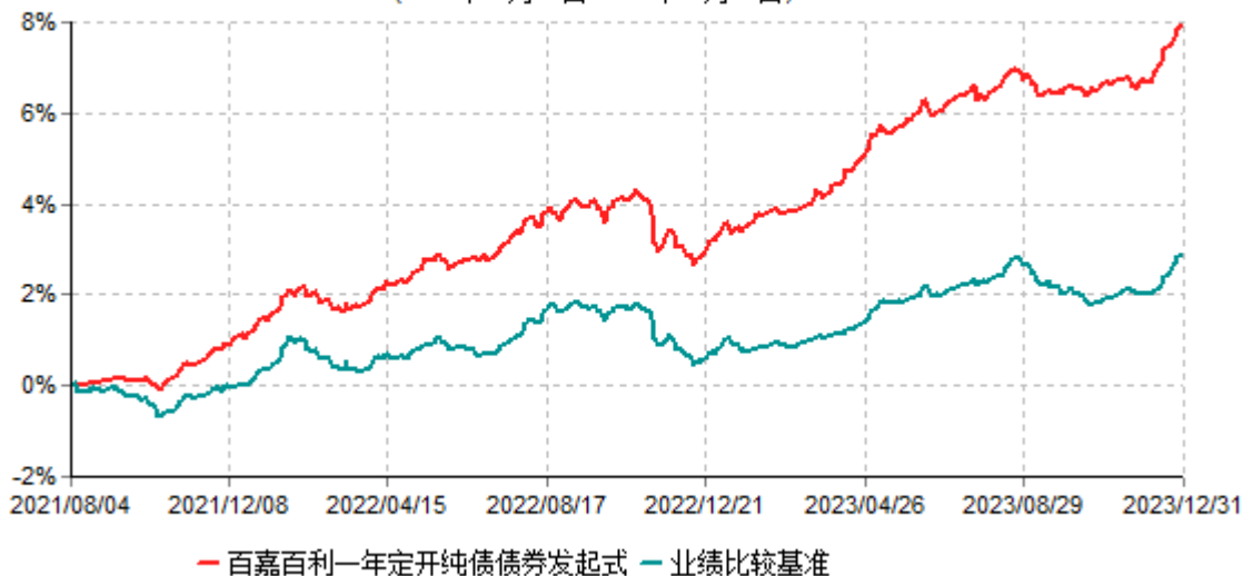
百嘉百利一年定期开放纯债债券型发起式证券投资基金累计净值增长率与业绩比较基准收益率历史走势对比图 (2021年08月04日-2023年12月31日)

注：1、本基金基金合同于2021年8月4日生效，自基金合同生效日（含）起或自每一个开放期结束之日次日（含）起至12个公历月后对应日（如该对应日为非工作日或无该对应日，则顺延至下一个工作日）的前一日止的期间，为本基金的一个封闭期。本基金开放期不少于5个工作日且不超过20个工作日，具体时间由基金管理人在当期封闭期结束前公告。