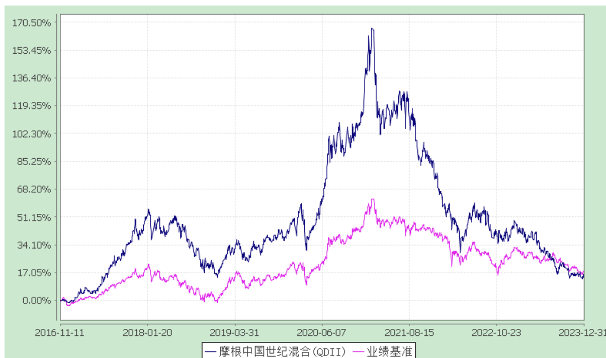
摩根中国世纪灵活配置混合型证券投资基金(QDII) 自基金合同生效以来份额累计净值增长率与业绩比较基准收益率历史走势对比图 (2016 年 11 月 11 日至 2023 年 12 月 31 日)

注：本基金合同生效日为 2016 年 11 月 11 日，图示的时间段为合同生效日至本报告期末。