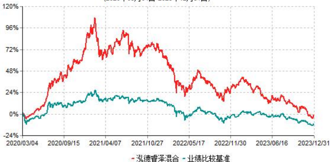
泓德睿泽混合型证券投资基金累计净值增长率与业绩比较基准收益率历史走势对比图 (2020年03月04日-2023年12月31日)

注：根据基金合同的约定，本基金建仓期为6个月，截至报告期末，本基金的各项投资比例符合基金合同关于投资范围及投资限制规定。