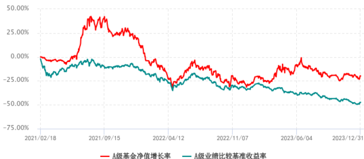
A 级基金份额累计净值增长率与同期业绩比较基准收益率历史走势对比图 (2021 年 02 月 18 日-2023 年 12 月 31 日)