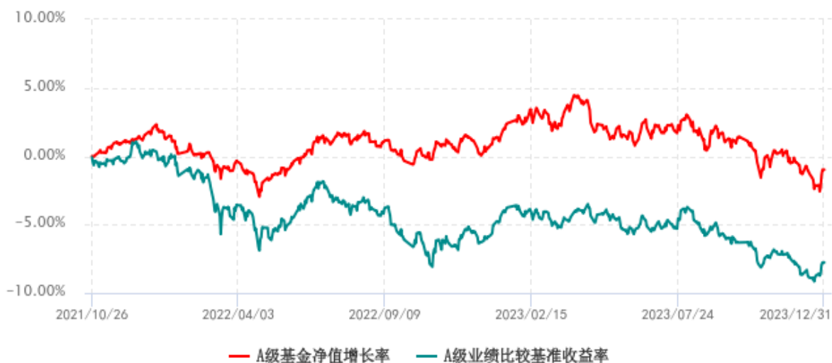
A 级基金份额累计净值增长率与同期业绩比较基准收益率历史走势对比图 (2021 年 10 月 26 日-2023 年 12 月 31 日)