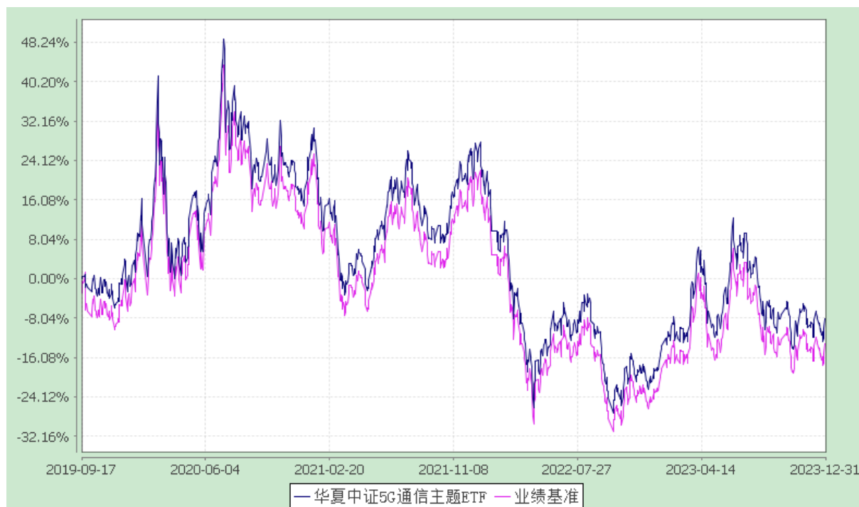
华夏中证 5G 通信主题交易型开放式指数证券投资基金 份额累计净值增长率与业绩比较基准收益率历史走势对比图 (2019 年 9 月 17 日至 2023 年 12 月 31 日)