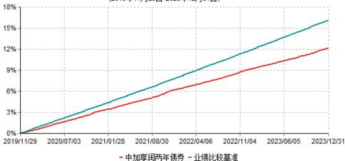
中加享润两年定期开放债券型证券投资基金累计净值增长率与业绩比较基准收益率历史走势对比图 (2019年11月29日-2023年12月31日)