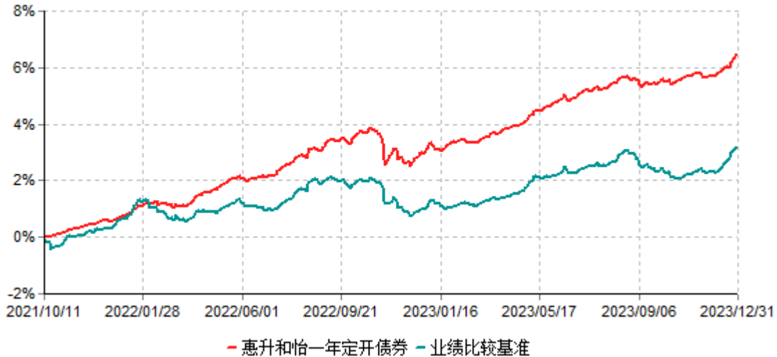
惠升和怡一年定期开放债券型发起式证券投资基金累计净值增长率与业绩比较基准收益率历史走势对比图 (2021年10月11日-2023年12月31日)