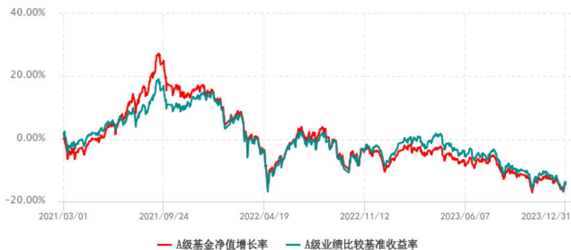
A级基金份额累计净值增长率与同期业绩比较基准收益率历史走势对比图 (2021年03月01日-2023年12月31日)