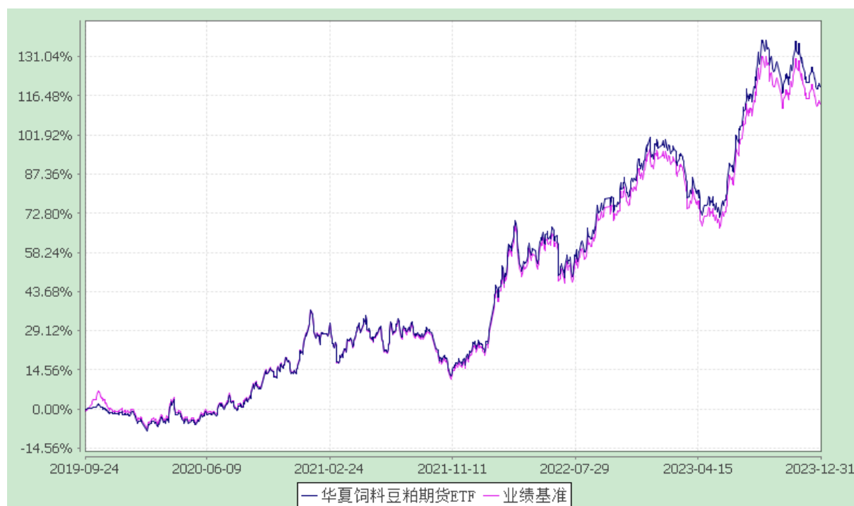
华夏饲料豆粕期货交易型开放式证券投资基金 份额累计净值增长率与业绩比较基准收益率历史走势对比图 (2019年9月24日至2023年12月31日)