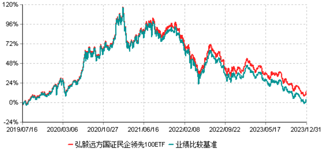
弘毅远方国证民企领先100交易型开放式指数证券投资基金累计净值增长率与业绩比较基准 收益率历史走势对比图 (2019年07月16日-2023年12月31日)

注：本基金基金合同生效日为2019年7月16日。截至建仓期结束，本基金各项资产配置比例符合基金合同及招募说明书有关投资比例的约定。