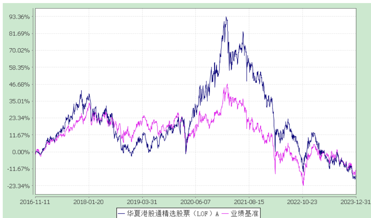
华夏港股通精选股票 C