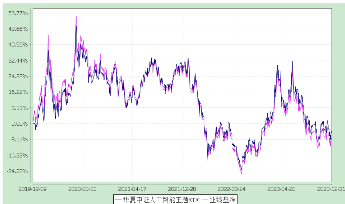
华夏中证人工智能主题交易型开放式指数证券投资基金 份额累计净值增长率与业绩比较基准收益率历史走势对比图 (2019年12月9日至2023年12月31日)