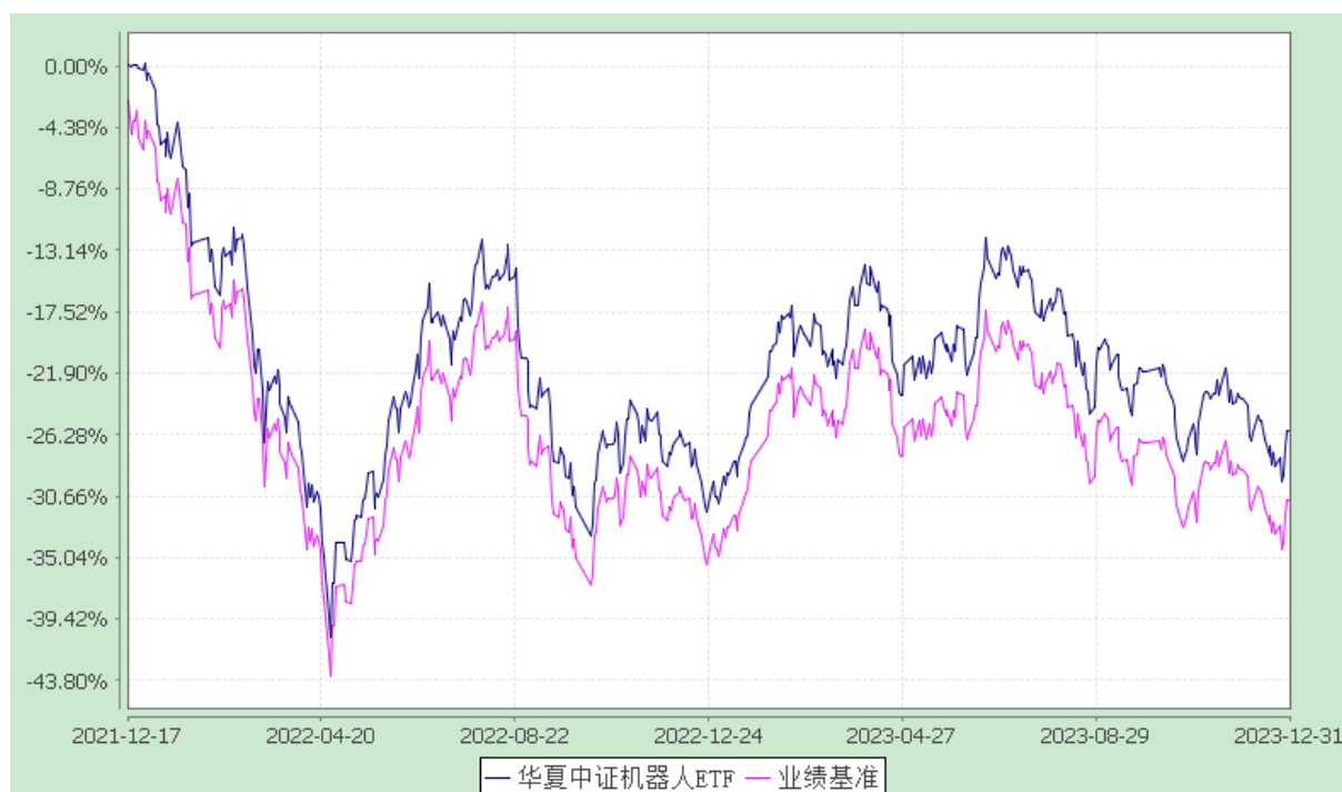
华夏中证机器人交易型开放式指数证券投资基金 份额累计净值增长率与业绩比较基准收益率历史走势对比图 (2021年12月17日至2023年12月31日)