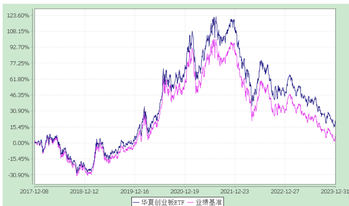
华夏创业板交易型开放式指数证券投资基金 份额累计净值增长率与业绩比较基准收益率历史走势对比图 (2017年12月8日至2023年12月31日)