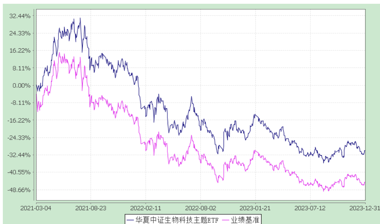
华夏中证生物科技主题交易型开放式指数证券投资基金 份额累计净值增长率与业绩比较基准收益率历史走势对比图 (2021年3月4日至2023年12月31日)