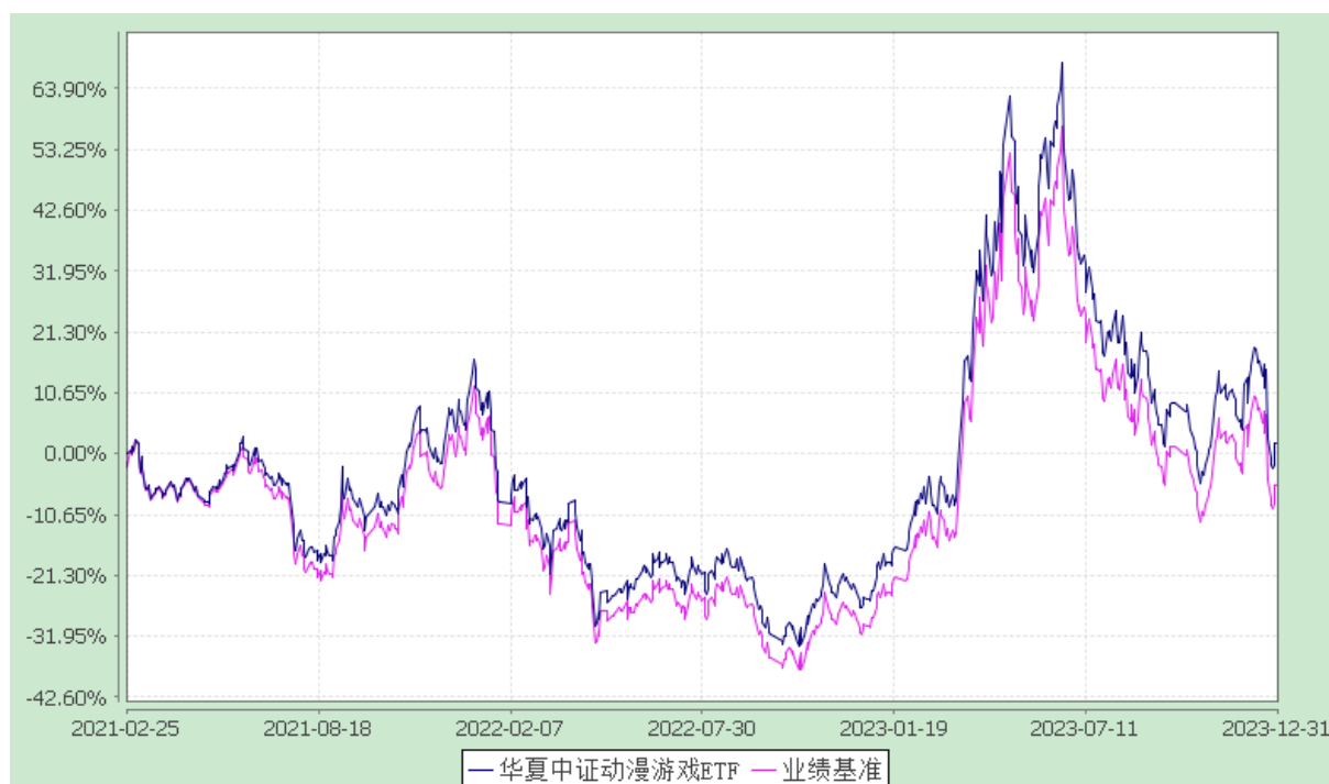
华夏中证动漫游戏交易型开放式指数证券投资基金 份额累计净值增长率与业绩比较基准收益率历史走势对比图 (2021年2月25日至2023年12月31日)