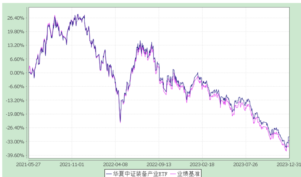
华夏中证装备产业交易型开放式指数证券投资基金 份额累计净值增长率与业绩比较基准收益率历史走势对比图 (2021年5月27日至2023年12月31日)