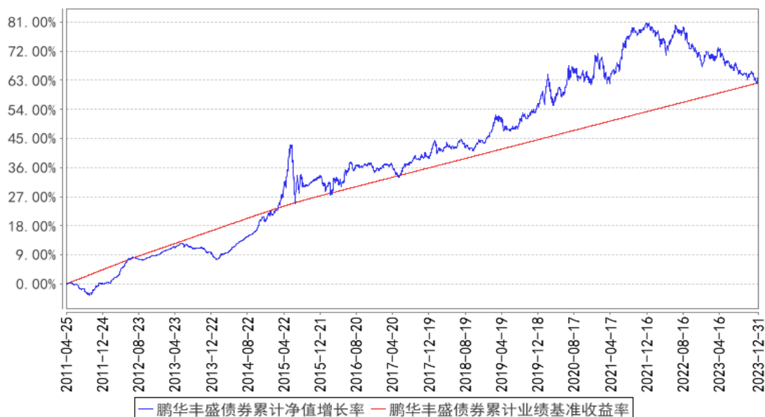
鹏华丰盛债券累计净值增长率与同期业绩比较基准收益率的历史走势对比图

注：1、本基金基金合同于 2011 年 04 月 25 日生效。2、截至建仓期结束，本基金的各项投资比例已达到基金合同中规定的各项比例。