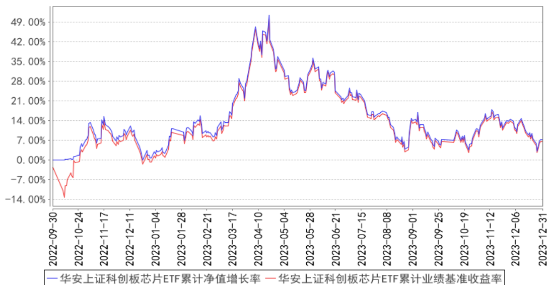
华安上证科创板芯片ETF累计净值增长率与同期业绩比较基准收益率的历史走势对比图