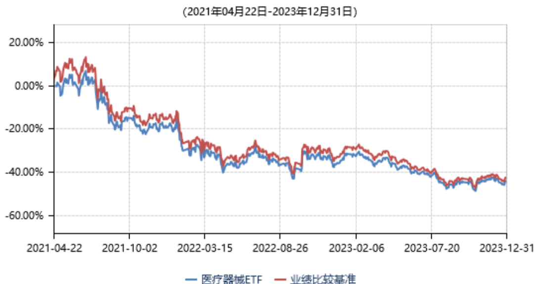
永赢中证全指医疗器械交易型开放式指数证券投资基金累计净值收益率与业绩比较基准收益率历史走势对比图