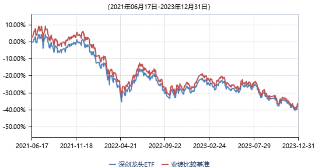
永赢深证创新100交易型开放式指数证券投资基金累计净值收益率与业绩比较基准收益率历史走势对比图