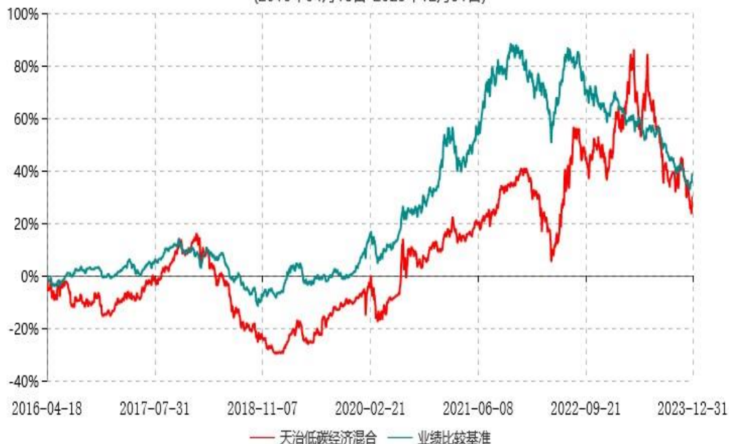
天治低碳经济灵活配置混合型证券投资基金累计净值增长率与业绩比较基准收益率历史走势对比图 (2016年04月18日-2023年12月31日)