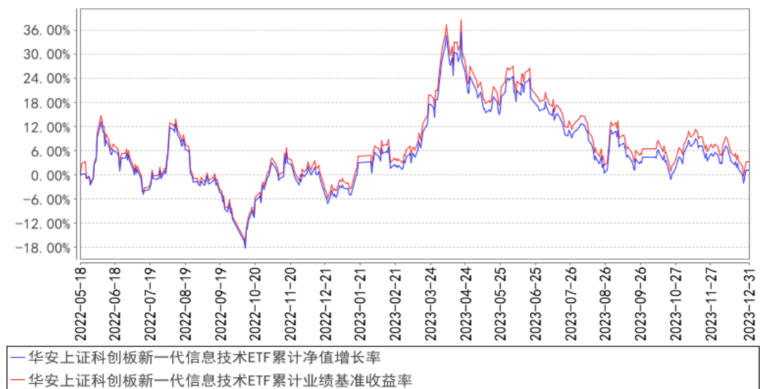
华安上证科创板新一代信息技术ETF累计净值增长率与同期业绩比较基准收益率的历史走势对比图