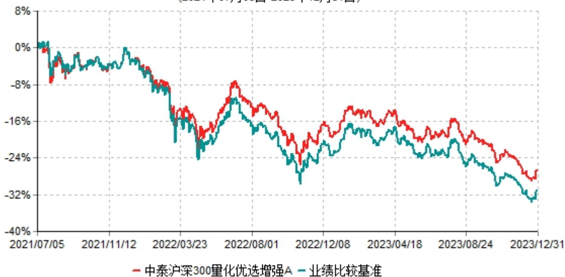
中泰沪深300量化优选增强A累计净值增长率与业绩比较基准收益率历史走势对比图 (2021年07月05日-2023年12月31日)