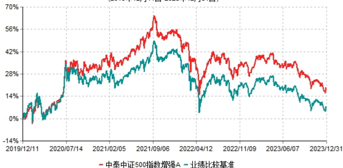
中泰中证500指数增强A累计净值增长率与业绩比较基准收益率历史走势对比图 (2019年12月11日-2023年12月31日)