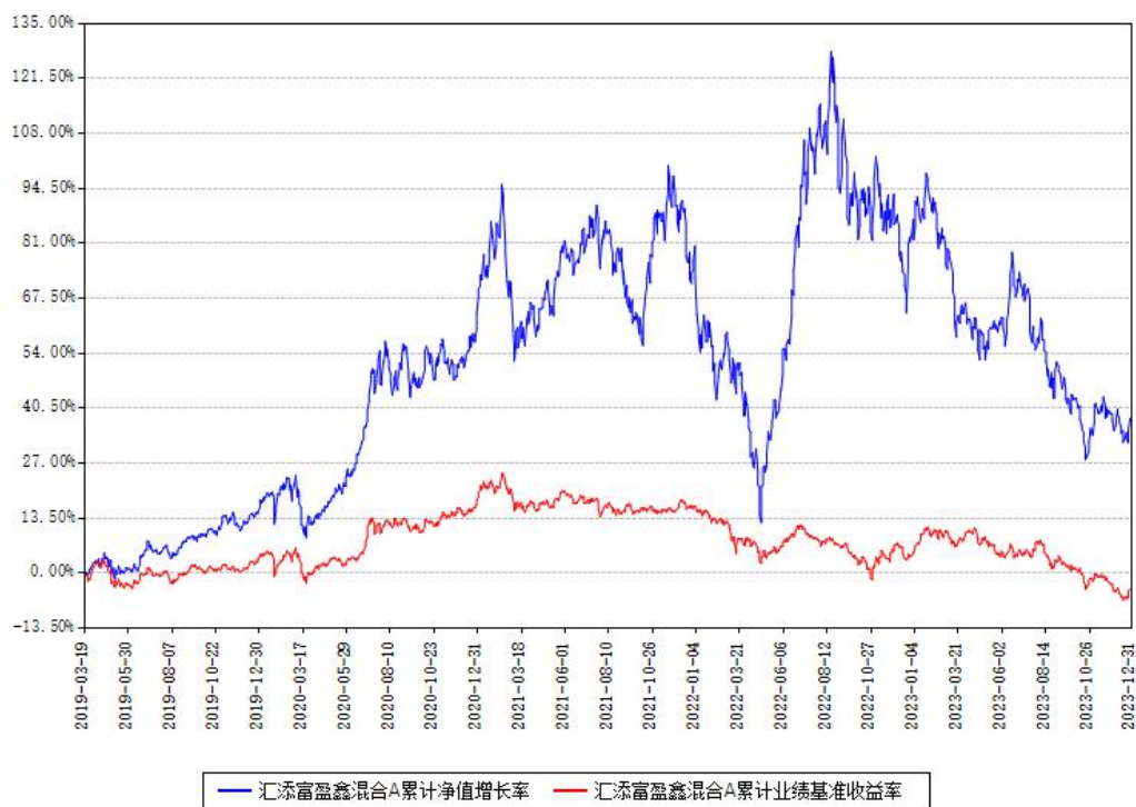
汇添富盈鑫混合A累计净值增长率与同期业绩基准收益率对比图

(二) 自基金合同生效以来基金累计净值增长率变动及其与同期业绩比较基准收益率变动的比较图