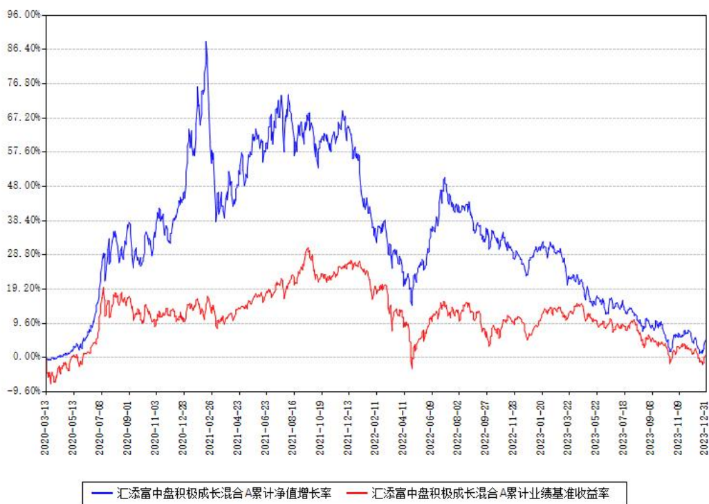
汇添富中盘积极成长混合A累计净值增长率与同期业绩基准收益率对比图