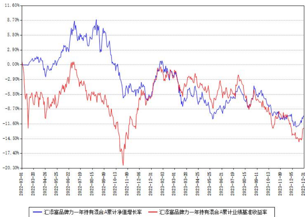
汇添富品牌力一年持有混合A累计净值增长率与同期业绩基准收益率对比图