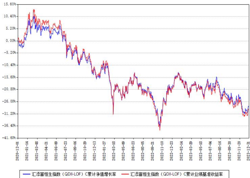
汇添富恒生指数 (QDII-LOF) C 累计净值增长率与同期业绩基准收益率对比图