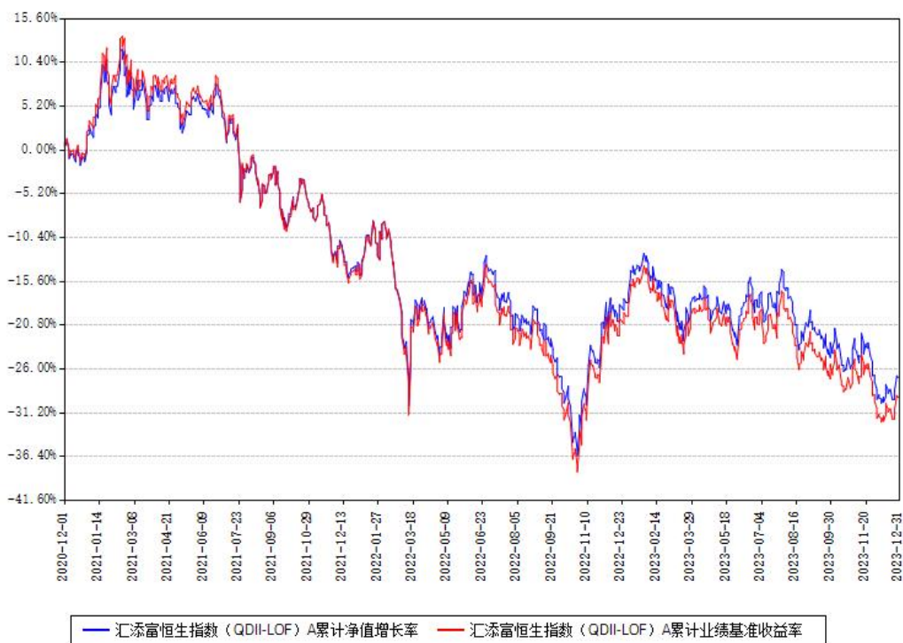
汇添富恒生指数 (QDII-LOF) A 累计净值增长率与同期业绩基准收益率对比图