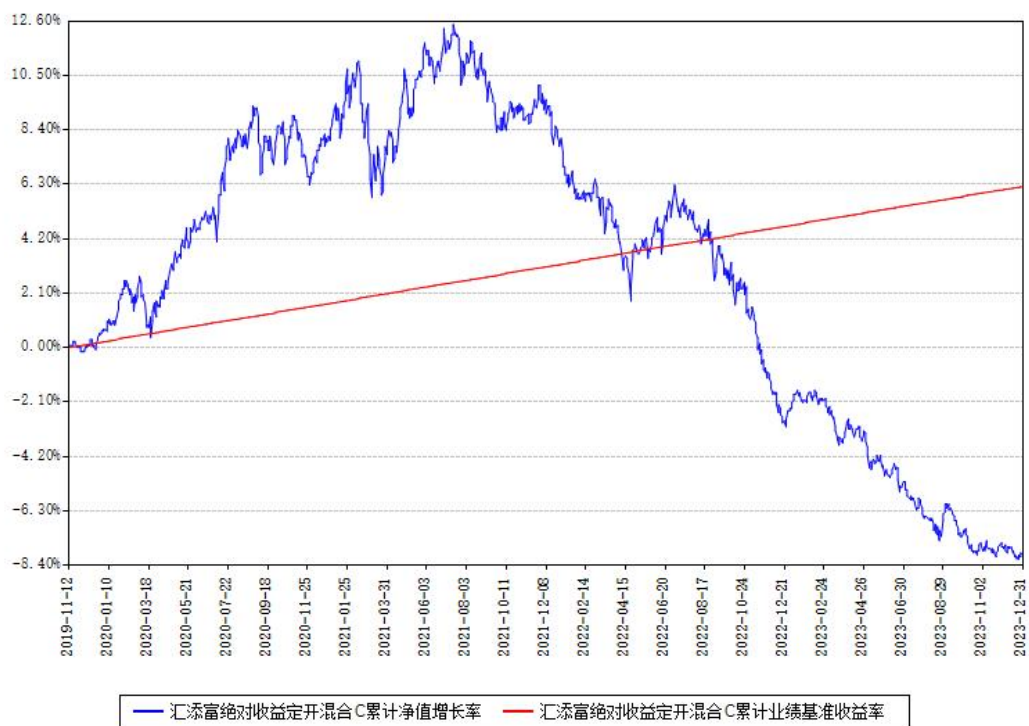
汇添富绝对收益定开混合C累计净值增长率与同期业绩基准收益率对比图