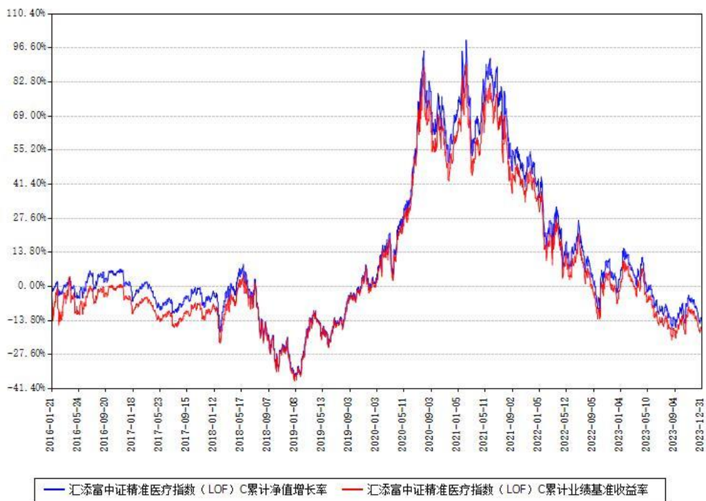
汇添富中证精准医疗指数（LOF）C累计净值增长率与同期业绩基准收益率对比图