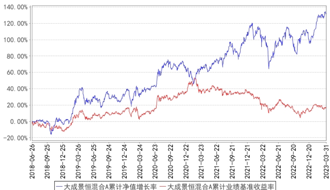
大成景恒混合A累计净值增长率与同期业绩比较基准收益率的历史走势对比图

(二) 自基金合同生效以来基金份额累计净值增长率变动及其与同期业绩比较基准收益率变动的比较