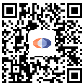
国泰君安资管APP下载二维码

如本招募说明书存在任何您/贵机构无法理解的内容，请通过上述客户服务电话或其他方式联系基金管理人。请确保投资前，您/贵机构已经全面理解了本招募说明书。