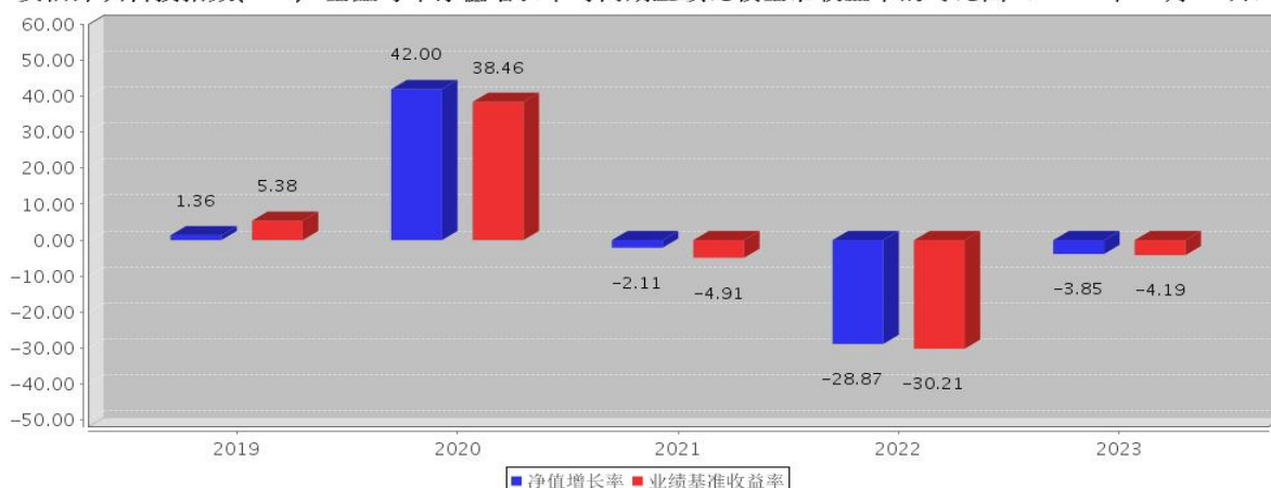
安信深圳科技指数(LOF)A基金每年净值增长率与同期业绩比较基准收益率的对比图(2023年12月31日)

注：基金合同生效当年期间的相关数据按实际存续期计算。基金的过往业绩并不代表其未来表现。