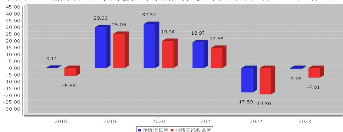
安信中证500指数增强C基金每年净值增长率与同期业绩比较基准收益率的对比图（2023年12月31日）

注：基金合同生效当年期间的相关数据按实际存续期计算。基金的过往业绩并不代表其未来表现。