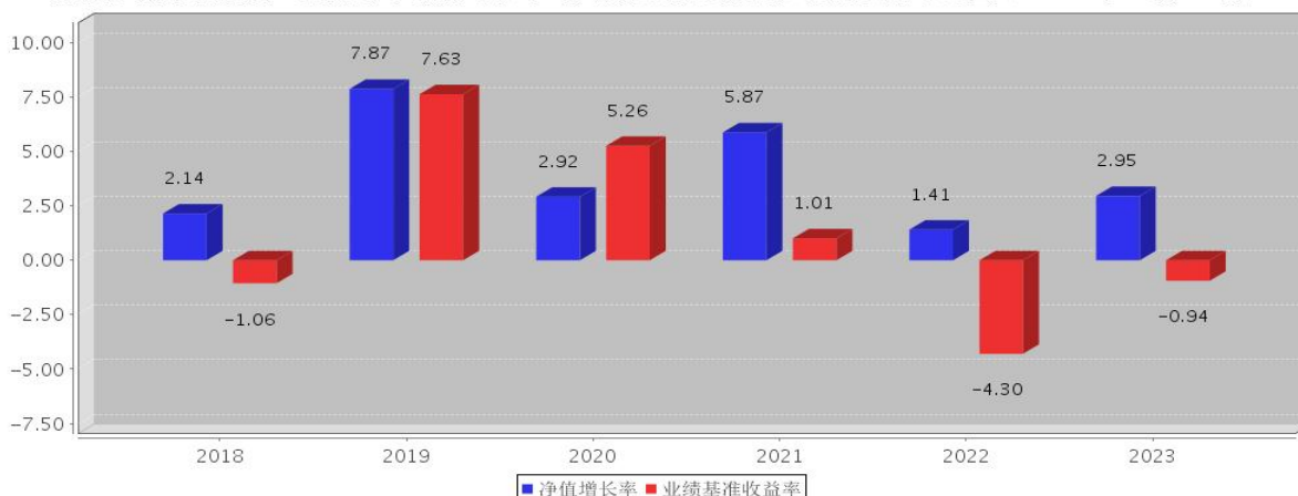
安信永鑫增强债券A基金每年净值增长率与同期业绩比较基准收益率的对比图（2023年12月31日）

注：基金合同生效当年期间的相关数据按实际存续期计算。基金的过往业绩并不代表其未来表现。本基金由安信永鑫定期开放债券型证券投资基金变更注册而来。根据2018年5月14日基金份额持有人大会决议，自2018年6月12日起，《安信永鑫增强债券型证券投资基金基金合同》生效，《安信永鑫定期开放债券型证券投资基金基金合同》同一日起失效。