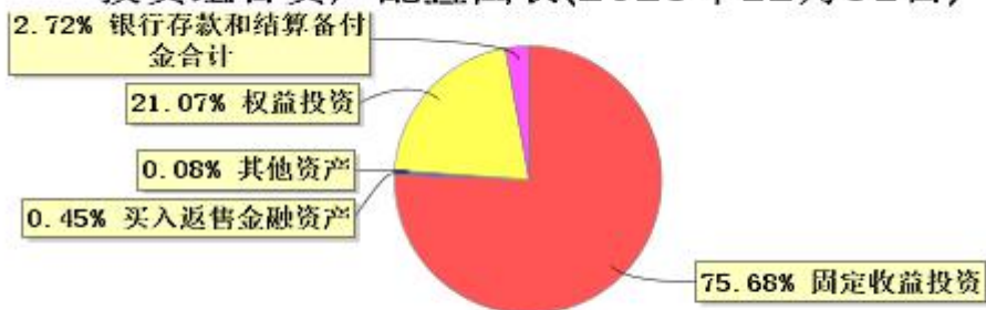
投资组合资产配置图表(2023年12月31日)

● 固定收益投资 ● 买入返售金融资产 ● 其他资产 ● 权益投资 ● 银行存款和结算备付金合计