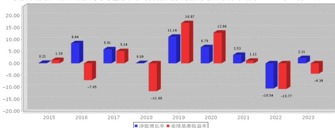
安信平稳增长混合C基金每年净值增长率与同期业绩比较基准收益率的对比图（2023年12月31日）

注：基金合同生效当年期间的相关数据按实际存续期计算。基金的过往业绩并不代表其未来表现。