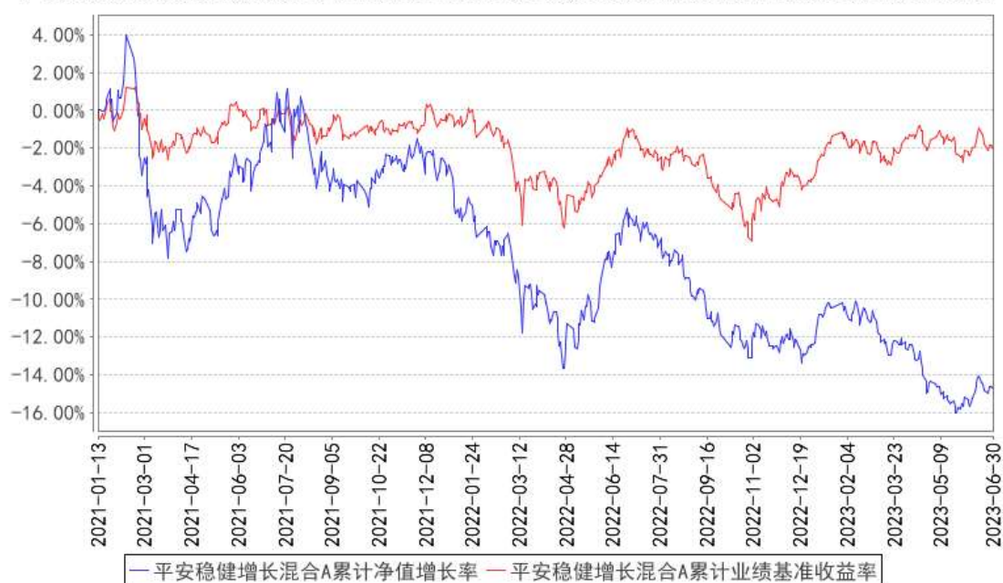
平安稳健增长混合A累计净值增长率与同期业绩比较基准收益率的历史走势对比图