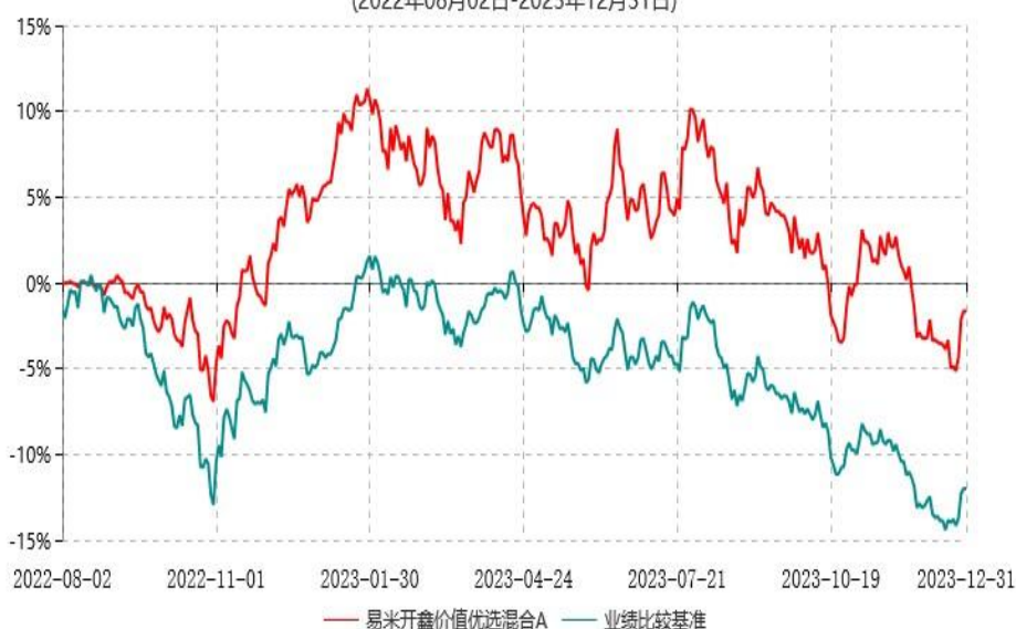
易米开鑫价值优选混合C累计净值增长率与业绩比较基准收益率历史走势对比图