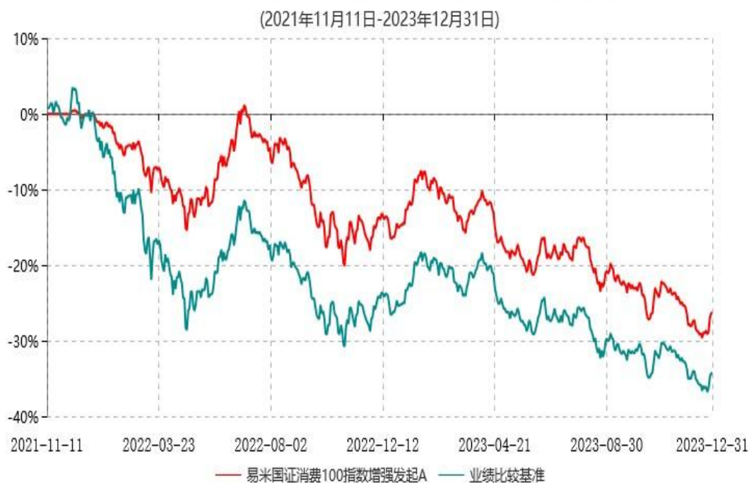
易米国证消费100指数增强发起A累计净值增长率与业绩比较基准收益率历史走势对比图