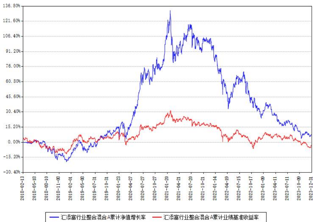
汇添富行业整合混合A累计净值增长率与同期业绩基准收益率对比图