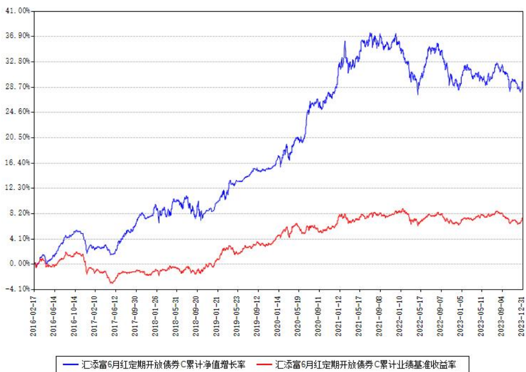
汇添富6月红定期开放债券C累计净值增长率与同期业绩基准收益率对比图