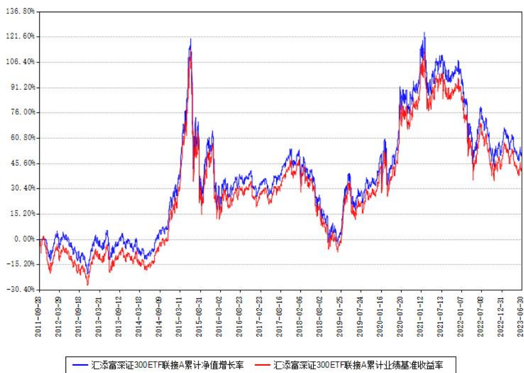
汇添富深证300ETF联接A累计净值增长率与同期业绩基准收益率对比图

(二) 自基金合同生效以来基金累计净值增长率变动及其与同期业绩比较基准收益率变动的比较图